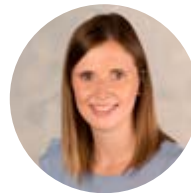
Luisa Ahlbach Personalmanagement

Die Preis-Gruppe fördert diese Erfolge mit einer spannenden Ausbildung und der Möglichkeit an nebenberuflichen Aus- und Weiterbildungen teilzunehmen, um sich beruflich und persönlich weiterzuentwickeln.